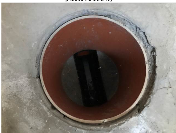
Foto č.15 – Šachta ve skladu zimního vybavení – blíže k obvodovému zdivu