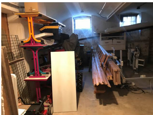
Foto č.11 – Neřešené prostory suterénu – sklad vedle dílny školníka