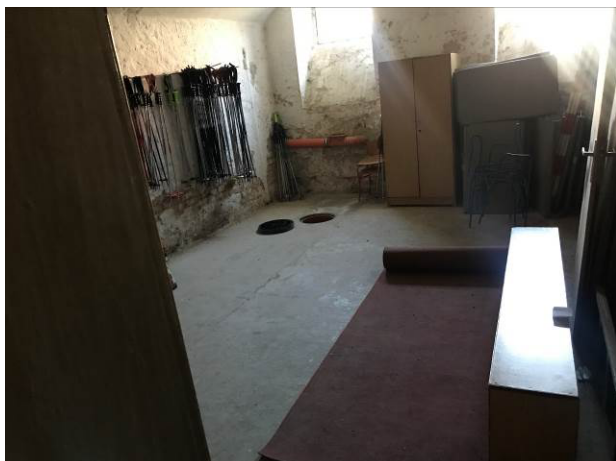
Foto č.13 – Sklad zimního vybavení, zde jsou dvě nové plastové šachty