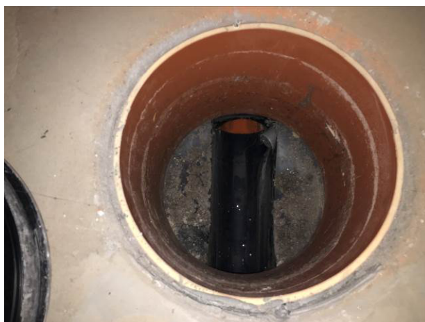
Foto č.16 – Šachta ve skladu zimního vybavení – šachta k chodbě suterénu