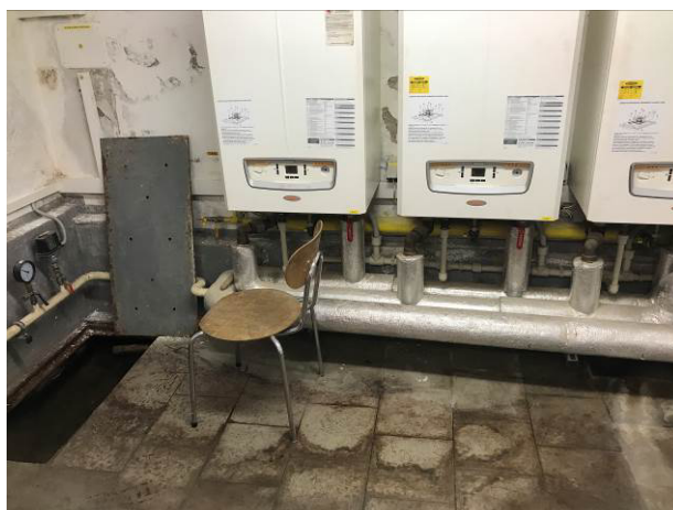
Foto č.4 – Zařízení kotelny s šachtou na jímání spodní vody v rohu kotelny