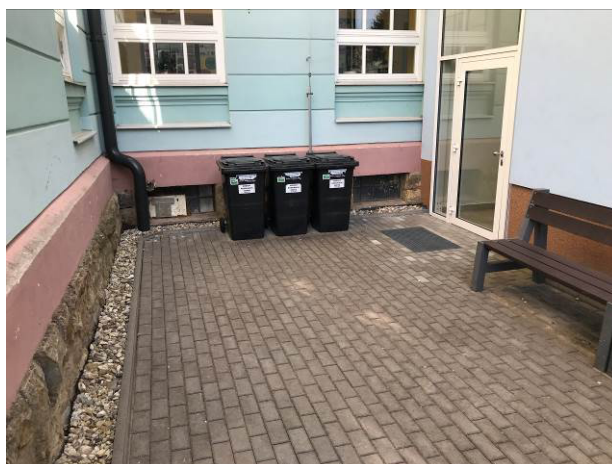
Foto č.18 – Nádvoří, které navazuje na suterénní prostor chodby a kotelny