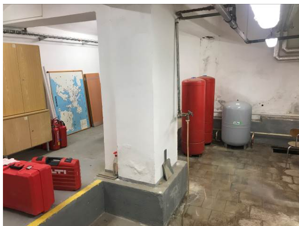
Foto č.2 – Pohled, kde jsou viditelné vlhkostní poruchy na stěnách a spodní voda na podlaze