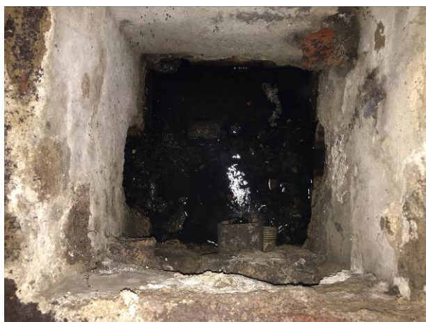
Foto č.12 – Kanalizační šachta ve skladu vedle dílny školníka, zde je napojen samospádem odvod z jímky kotelny, šachta je odvedena do venkovní kanalizace